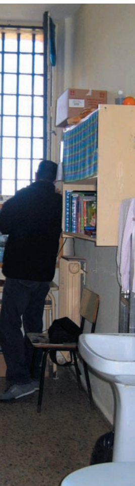
es al ver que sus voces la cárcel.