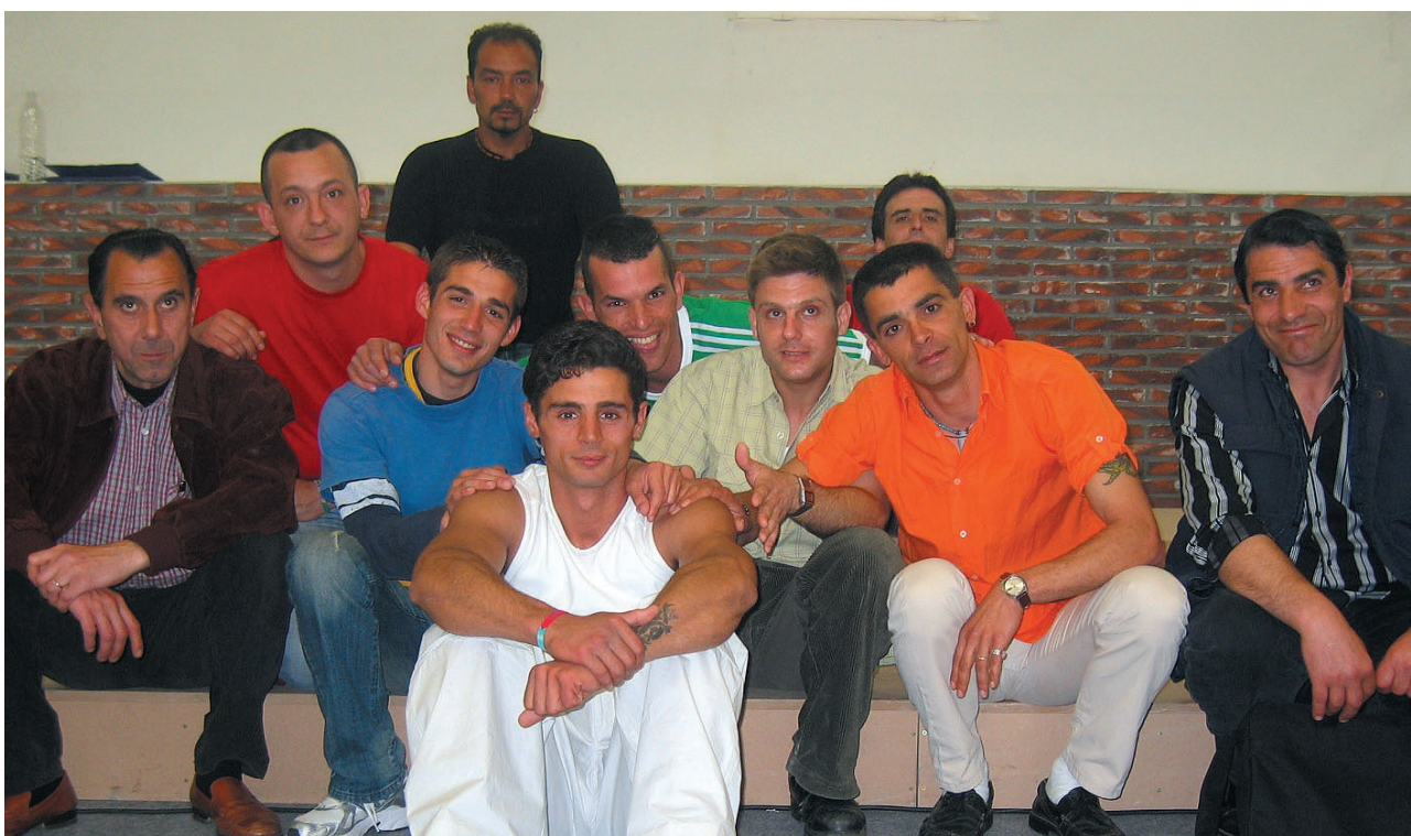
“El coro de la cárcel” une la emoción del concurso, el interés de la serie y el valor del documental.

La Primera de TVE estrena el miércoles 5 de julio , a las 22:00 horas , “El coro de la cárcel” . Este programa es el reflejo de una innovadora experiencia musical en la que participan doce reclusos del centro penitenciario de El Dueso , en Santoña (Cantabria). Los presos cuentan con el apoyo y la colaboración de dos profesionales elegidas para la ocasión: una psicóloga de Instituciones Penitenciarias y una profesora de canto.