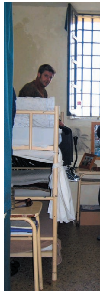
Los doce se sentirán algo más libres escapando más allá de los muros de la prisión.