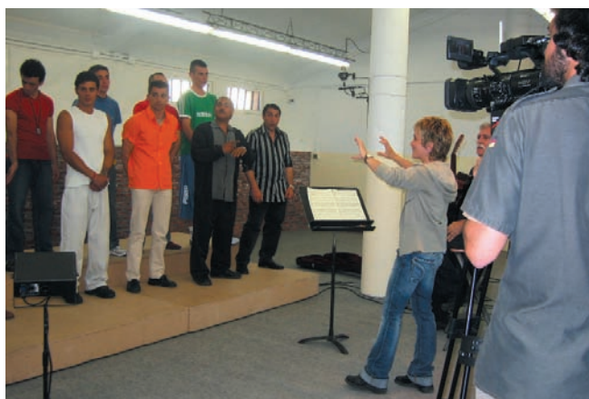
Tras la selección en un "casting", los miembros del coro ensayan en la sala de música del penal.