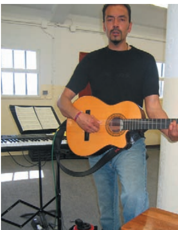
El coro rompe la rutina y ayuda a superar las dificultades de convivencia.