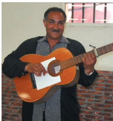
Cada semana, el coro ensayará una canción hasta sumar las diez del gran concierto final.