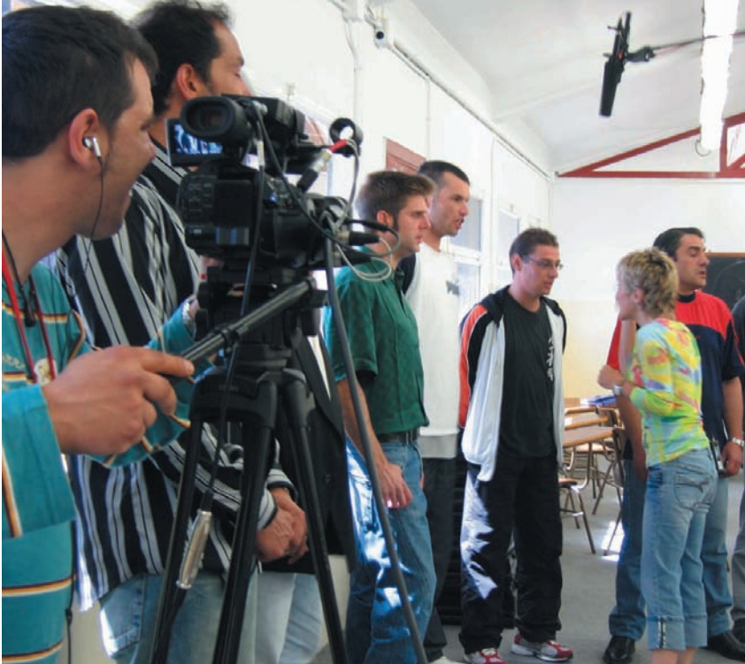
Las cámaras acompañan a los reclusos en los ensayos y se cuelan en su vida en la prisión.

reclusos miembros del coro, compartiendo sus conocimientos e intentando que una docena de cantantes aficionados se conviertan en un coro armonioso.