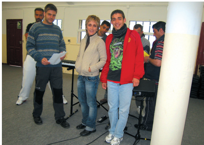
Poco a poco, los miembros del coro se irán conociendo.

El primer paso es seleccionar, entre más de 600 presos, a los doce reclusos que formarán el coro. La serie empieza con un "casting" del que saldrán los doce elegidos quienes, durante dos meses, ensayarán diez canciones que luego interpretarán para todos sus compañeros. "El coro de la cárcel" muestra las peripecias y experiencias que viven las dos profesionales –la psicóloga y la profesora de canto– que conviven durante dos meses con los