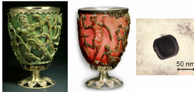
Copa de Lycurgus (siglo IV a.C.) iluminada desde el exterior (izquierda) y desde el interior (centro), e imagen de microscopio electrónico de una nanopartícula de oro encontrada en el vidrio del que está hecha (derecha).

En cambio, la nanotecnología se sitúa en la esfera de la voluntad, la memoria y el entendimiento humanos, aspectos consustanciales del método científico que la distancian de los azares históricos o naturales. Por primera vez en la historia somos capaces de dominar, registrar y entender el mundo microscópico a la escala más pequeña posible, compatible con las condiciones ambientales de nuestro entorno. La nanotecnología aspira a perfeccionar ese control y hacerlo útil, y muchos científicos y tecnólogos la elevan al rango de revolución: la conjunción de diferentes campos del saber en una fiesta de interdisciplinaridad donde las materias tradicionales se desdibujan en favor de una gran ciencia al estilo renacentista y donde se adivinan paradigmas insospechados de amplia repercusión social.