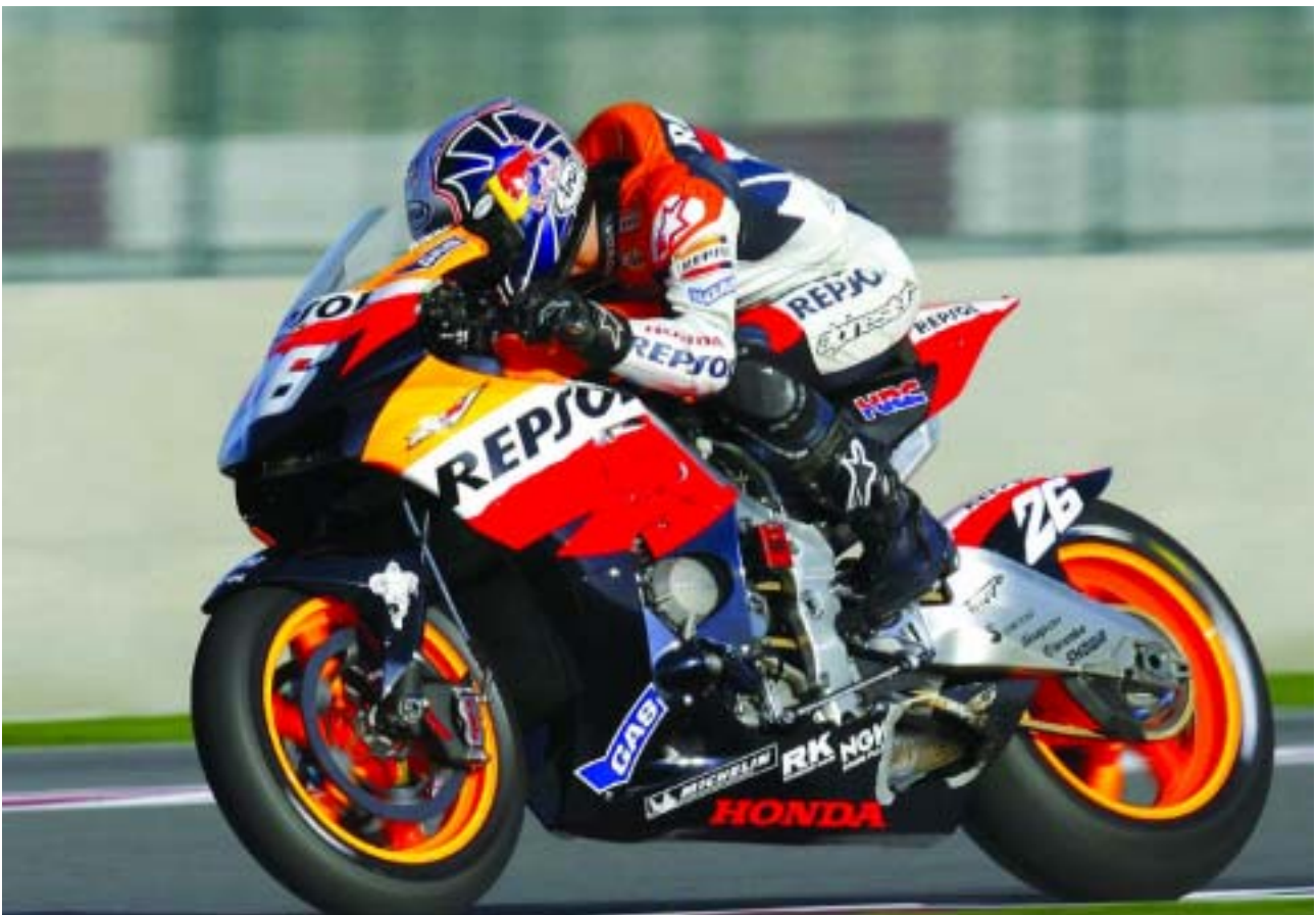
Dani Pedrosa en acción: vuelve el gran espectáculo de la velocidad a TVE.

Los mejores momentos del motociclismo español se han vivido en TVE . La cadena pública viene contando, desde hace más de dos décadas, los triunfos de uno de los deportes que