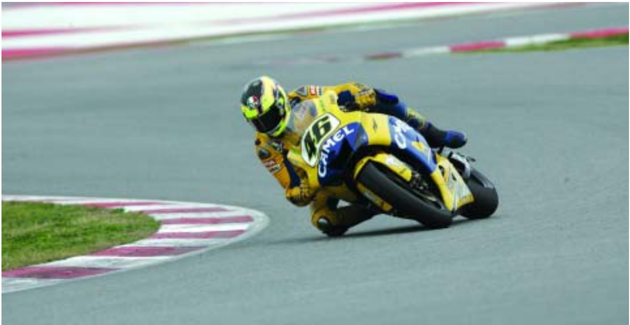
Valentino Rossi. Todos los pesos pesados se dan cita en Jerez.