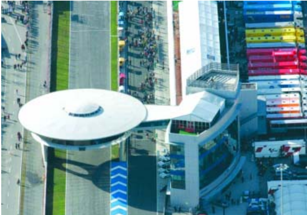
El Circuito de Jerez, la cita más multitudinaria del Campeonato del Mundo de MotoGP.