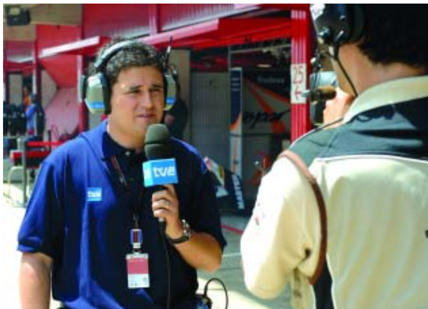
Un gran equipo de profesionales de Televisión Española se encargará de las retransmisiones.