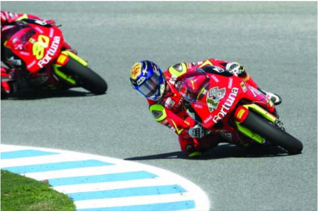
Jorge Lorenzo, Campeón del Mundo de 250cc, otra de las estrellas del Mundial.