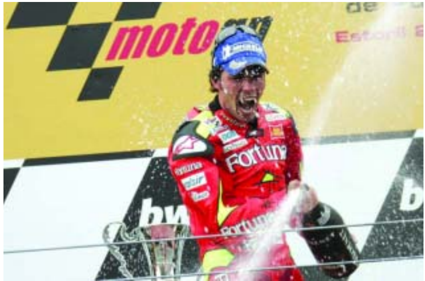
Los éxitos de los pilotos españoles se vivirán de cerca en TVE.

Con muchos de estos protagonistas, incluso nos subiremos a la moto para analizar junto a ellos, el trazado de cada circuito. Los propios pilotos nos contarán desde el asfalto dónde encuentran las dificultades