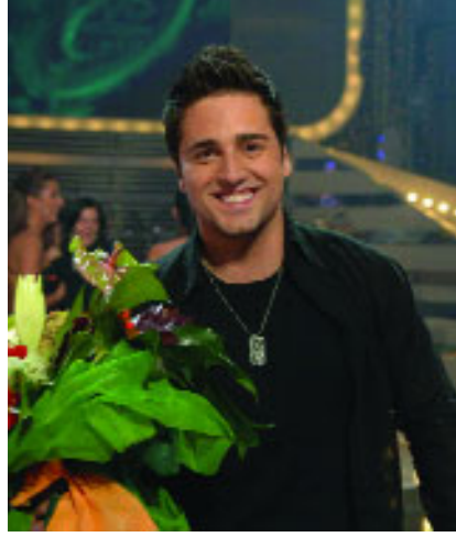
David Bustamante, vencedor de los especiales de Navidad.