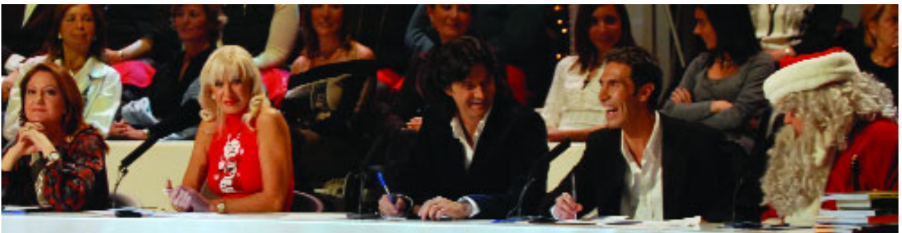
El jurado observará con detalle las evoluciones de los bailarines por la pista de baile. Y después... puntuará.

La vencedora de la primera edición, Claudia Molina , donó el premio a La Unión Nacional de Mujeres Saha-rauis. En la segunda entrega, David Civera quedó primero y destinó el premio a la Confederación Española de Familiares de Enfermos de Alzheimer; mientras que en la tercera, Rosa López cedió su premio a la Asociación Vitriol, dedicada a la lucha contra el cáncer.