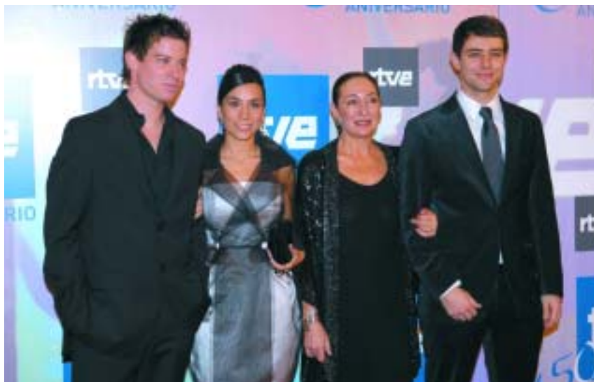
Protagonistas de "Amar en tiempos revueltos".