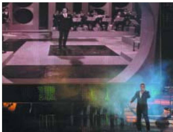
David Bisbal en su dúo con Antonio Molina.