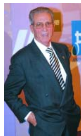
Federico Martín Bahamontes.