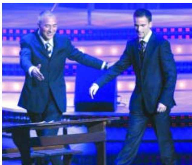
Javier Sardá y "Pedrito", veinte años después.