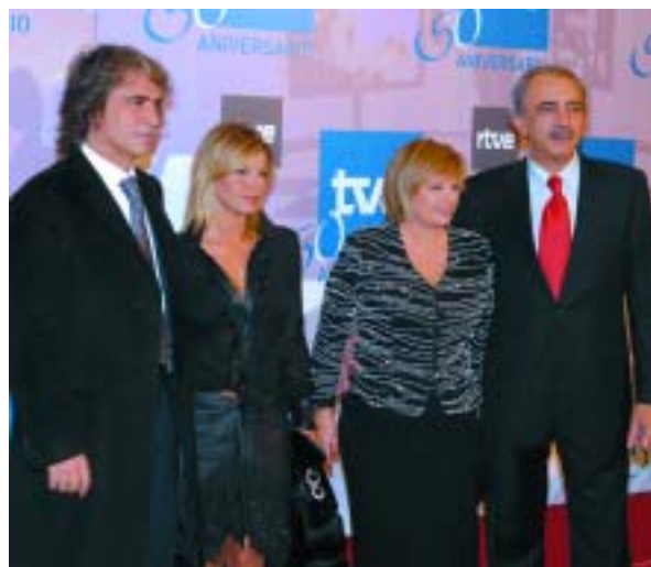
María Teresa Campos y Terelu acompañadas de sus parejas.