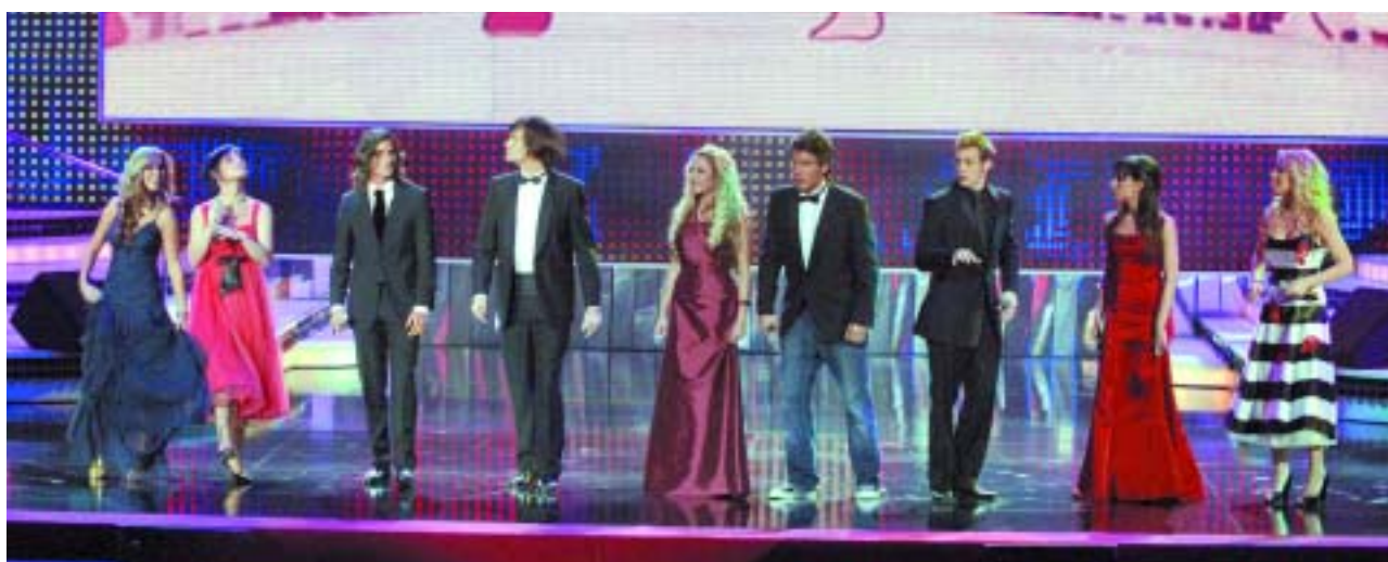
Representes de varias ediciones de "Operación Triunfo" durante su actuación en la gala.