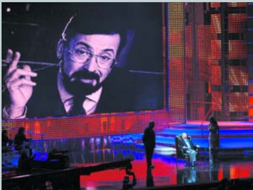
Chicho recuerda la historia profesional de Chicho.

Medio centenar largo de los más importantes premios del sector audiovisual avalan la trayectoria profesional de Narciso, "Chicho", Ibáñez Serrador . Su mejor premio: el aplauso de los televidentes.