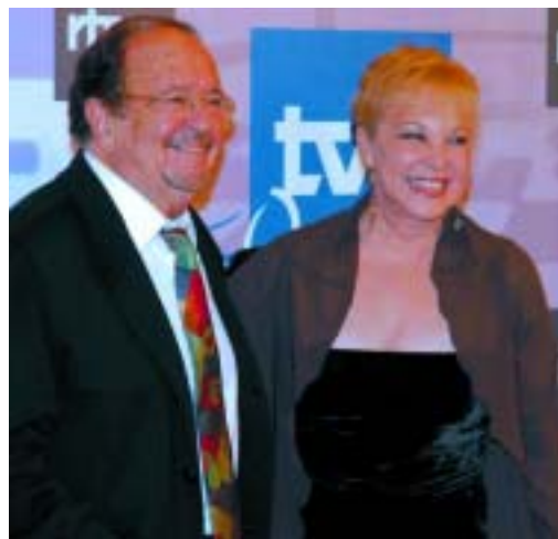
José Luis Uribarri y Karina.