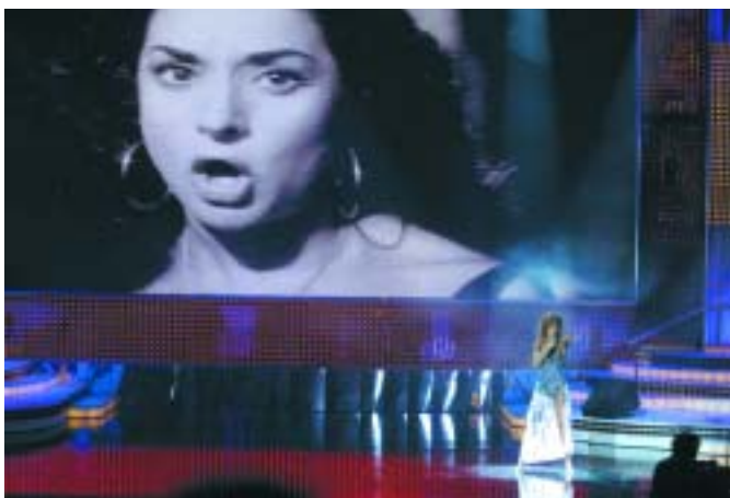
Malú hace un dúo con la gran Lola.

Rosa y Bisbal redondearán este capítulo musical con la interpretación de sus recientes éxitos “Nada más en mi corazón” y “Silencio”