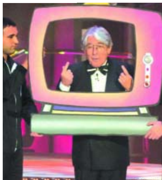
Alfredo Amestoy, un hombre de la pantalla.