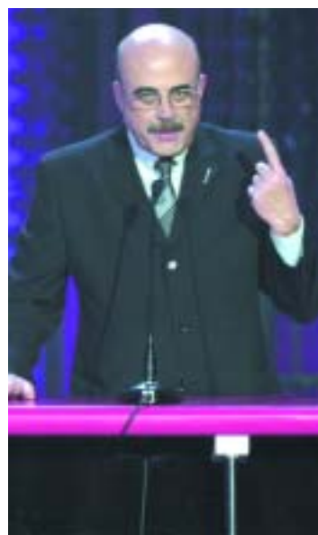
Constantino Romero, un hombre con una voz de oro.