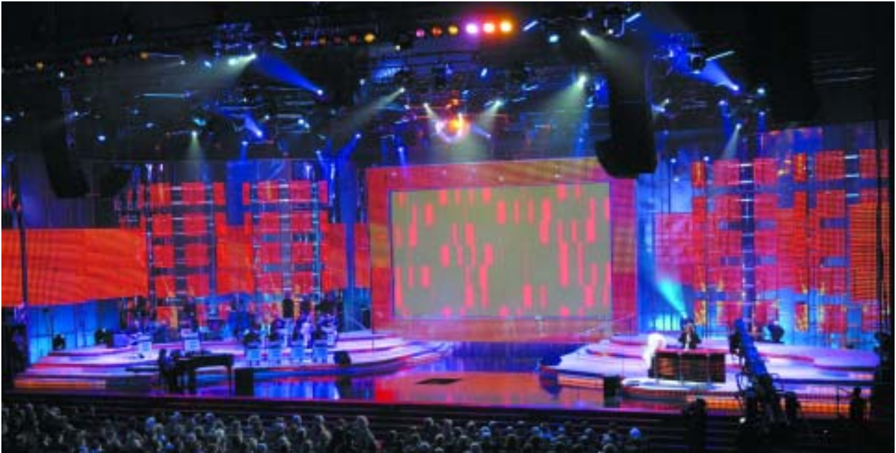
Un espectacular decorado presidido por una gran pantalla de televisión.