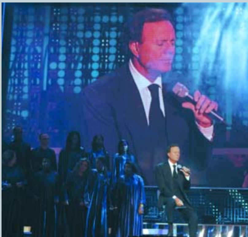
TVE dio a conocer a Julio Iglesias.

Julio regresa a TVE en su gala de bodas de oro , con la interpretación de su tema " I wanna Know what love is ", en el que está acompañado de un estupendo coro de voces.