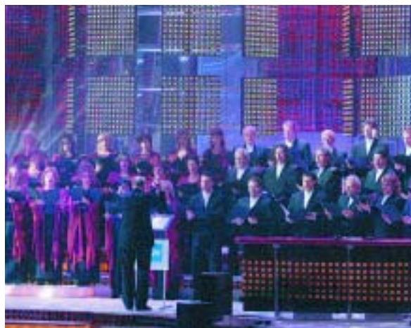
La coral interpreta sintonías de anuncios de televisión.