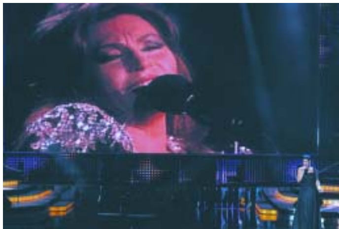
El dueto de Rosa con Rocío Jurado.