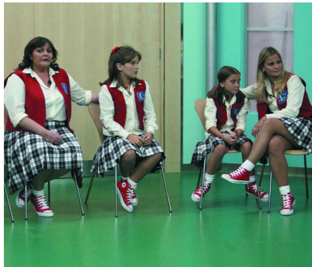
No habrá expulsados y podrán obtener premios semanales