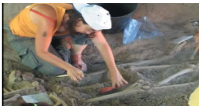
Exhumación de una fosa común en Extremadura.