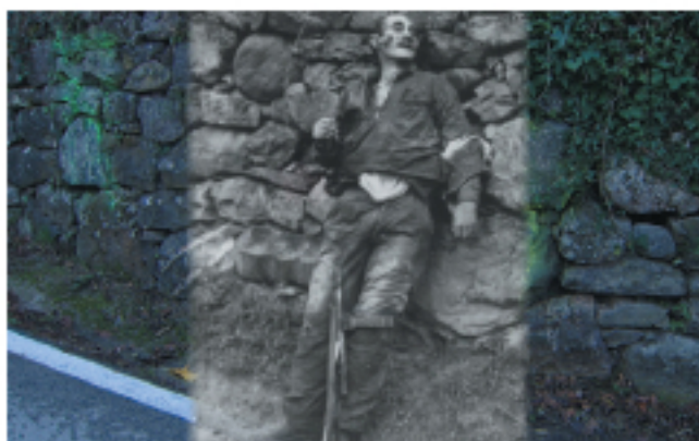
La historia de Juanín permite hacer un repaso por las fases de la guerrilla.