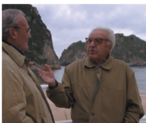
Aún quedan testigos que cuentan lo que vivieron y sufrieron.