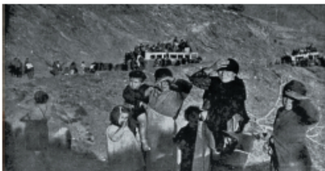
Imagen de archivo de la tristemente célebre "carretera de la muerte".