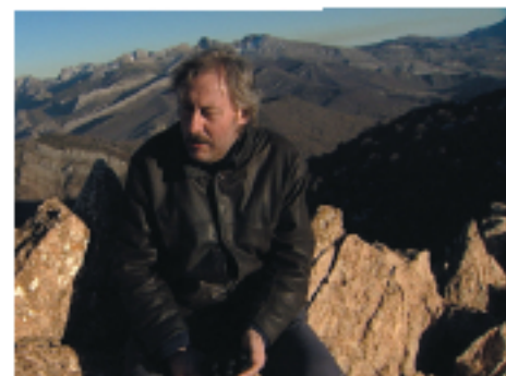
El escritor Julio Llamazares colabora en este capítulo de "La memoria recobrada" a su paso por los Montes de León.