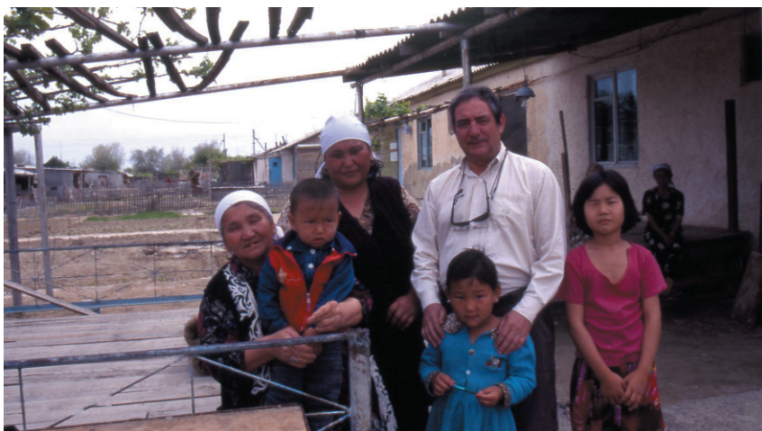
Luis Pancorbo regresa a La 2 con su veterana serie "Otros pueblos".

La undécima entrega de "Otros Pueblos", subtitulada "Encuentros", consta de 6 capítulos de una hora de duración grabados en Uzbekistán, Islas Cook, Uganda y Mongolia. Con estos nuevos capítulos asciende a 115 el número total de episodios emitidos de "Otros Pueblos" desde su estreno en 1983, siempre con el objetivo de acercar al público español realidades y costumbres de lugares insólitos del mundo. Además de divulgar diversas perspectivas antropológicas.