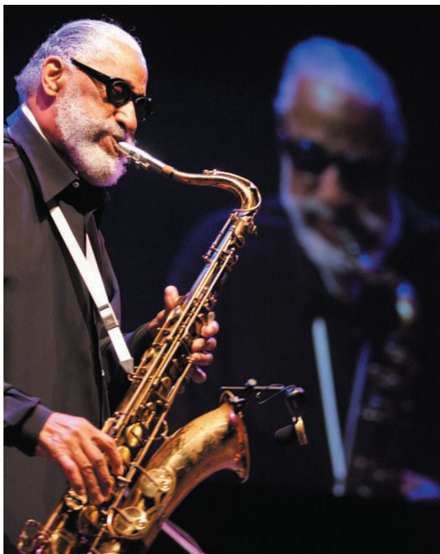
Sonny Rollins, toda una leyenda para el Festival de Jazz de Vitoria, un año más en La 2.

En el Festival de Jazz de Vitoria, el Vitoria-Gasteiz, los espectadores de La 2 podrán disfrutar en la edición