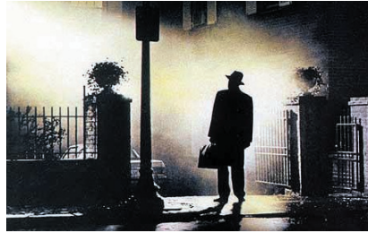
Los martes en "Alucine", terror y suspense con títulos como "El exorcista".

El terror, el suspense y los sucesos sobrenaturales llegan a La 2 en la noche de los martes. "Alucine" nos mantendrá bien despiertos con títu-