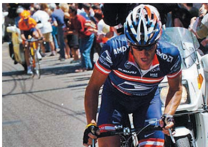
El Tour de Francia, una de las grandes citas deportivas del verano.

El tenis es otro de los deportes que cuenta con una cada vez mayor presencia en la programación de TVE. Tras el nuevo éxito cosechado por Rafa Nadal en el torneo de Roland Garros, -donde TVE ofreció todos los encuentros disputados por el campeón en su camino al éxito-, seguiremos atentamente su trayectoria y la del resto de tenistas españoles durante estos meses de verano. Sin olvidar a las chicas, que el fin de semana del 15 y 16 de julio tendrán