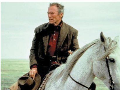
"Sin perdón", uno de los "westerns" que podremos ver en la noche del lunes.

El "prime-time" de La 2 empieza la semana con los clásicos del cine de indios y vaqueros. Áridos desiertos, montañas rocosas, salones de puertas batientes y pistolas humeantes en títulos tan destacados como "Sin perdón" de Clint Eastwood; "El bueno, el feo y el malo", clásico del "spaghetti western" dirigido por Sergio Leone; "La diligencia" de John Ford con John Wayne como protagonista; y "El último pistolero", que reunió a John Wayne, Lauren Bacall, Ron Howard y James Stewart a las órdenes de Don Siegel.