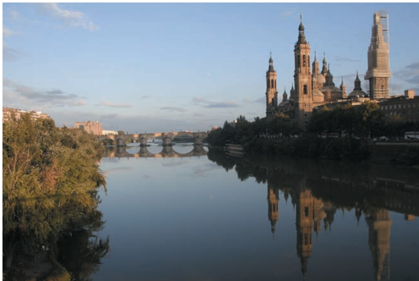
Zaragoza, escenario de lujo para "Ciudades para el siglo XXI".