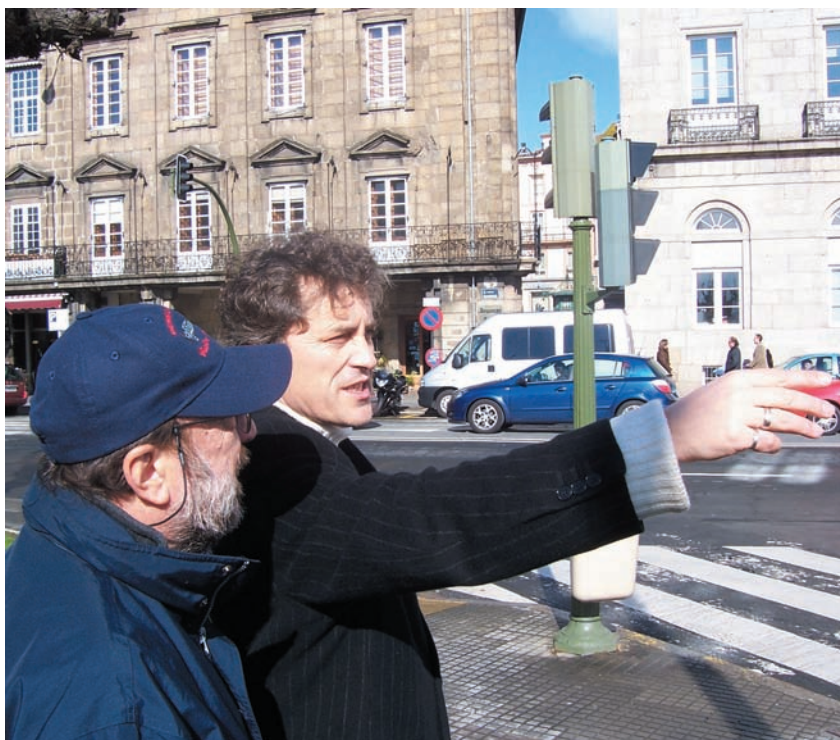
El escritor Manuel Rivas durante el rodaje de uno de los documentales de "La memoria recobrada".

La serie está dirigida por el escritor y documentalista Alfonso Domingo.