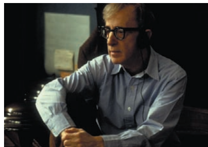
Woody Allen, protagonista de la noche de los miércoles en La 2.

La 2 inaugura un ciclo dedicado a Woody Allen con una selección de algunos de sus títulos más recientes. El ácido sentido del humor y la peculiar forma de ver la vida del director neoyorquino poblarán las noches de los miércoles gracias a películas como "Granujas de medio pelo", "Un final made in Hollywood", "Todo lo demás", "Desmontando a