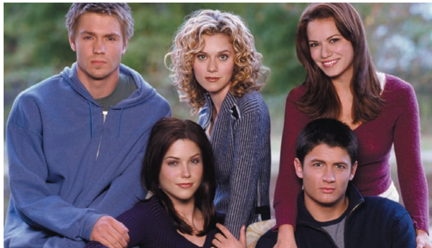
La esperada serie "One Tree Hill" llega a La 2, los jueves a las 22:30.

Actualmente estamos viendo los capítulos correspondientes a la tercera temporada de la serie, que seguirá con la cuarta y quinta entregas.