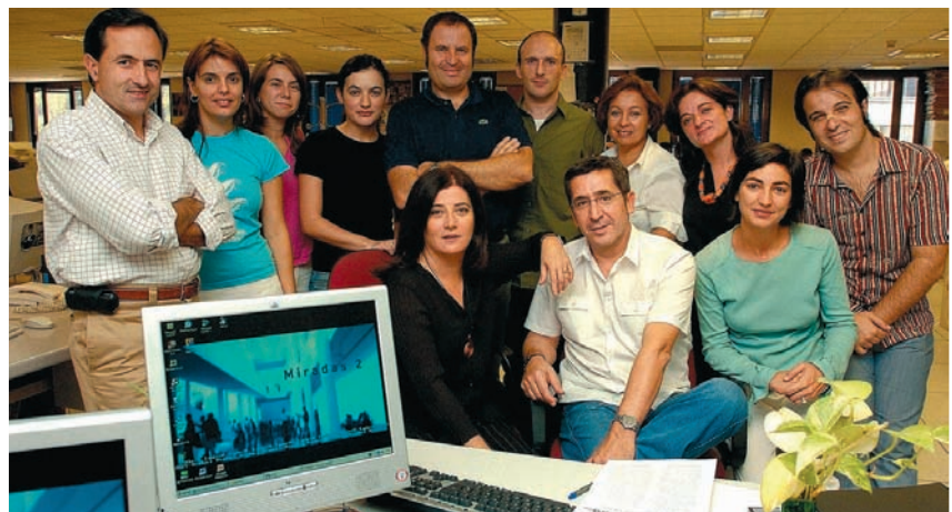
El equipo de "Miradas 2".

Quien no se marcha de vacaciones es el informativo cultural diario de La 2. Recién cumplido su programa número 300, "Miradas 2" continuará con sus emisiones los mismos días y a la misma hora de siempre para seguir ofreciendo información puntual de todos los festivales, estrenos, rodajes, exposiciones y propuestas culturales que se produzcan durante estos meses de calor en todos los rincones de nuestro país.