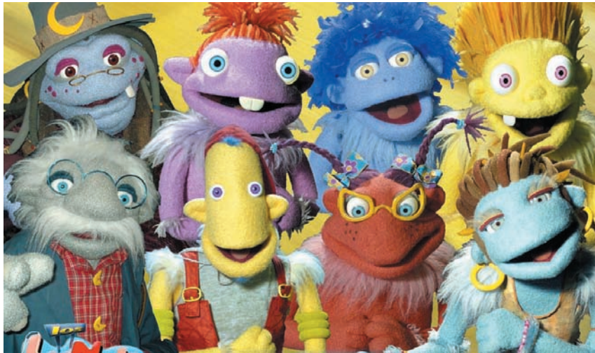
"Los Lunnis", compañeros ideales para el verano.

Mientras Jessica es traviesa, frívola y coqueta, Liz, además de ser una buena estudiante, es seria y se dedica a ayudar a los demás siempre que se le presenta la ocasión.