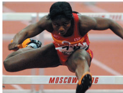
La 2 ofrece en agosto los Campeonatos de Europa de Atletismo, uno de los deportes clásicos de la cadena.

La natación también llevará a La 2 a visitar el refrescante azul de las piscinas, desde donde se ofrecerá amplia cobertura de dos acontecimientos destacados: los Campeonatos de España, que el 15 y 16 de julio se disputarán en Almería, y los Campeonatos de Europa en Budapest, del 27 de julio al 6 de agosto.