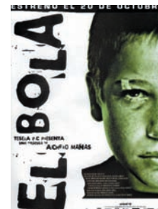
La noche de los viernes está dedicada al cine español en "Cine con Ñ".

Una vez concluido este ciclo, "Off cinema" retornará a su oferta habitual de películas de autor y cine independiente, con títulos como "Atando cabos", del director Lasse Hallström, interpretada por Kevin Spacey, Julianne Moore y Cate Blanchett; o "En la habitación", drama dirigido por Todd Field y protagonizado por Sissy Spacek y Tom Wilkinson.