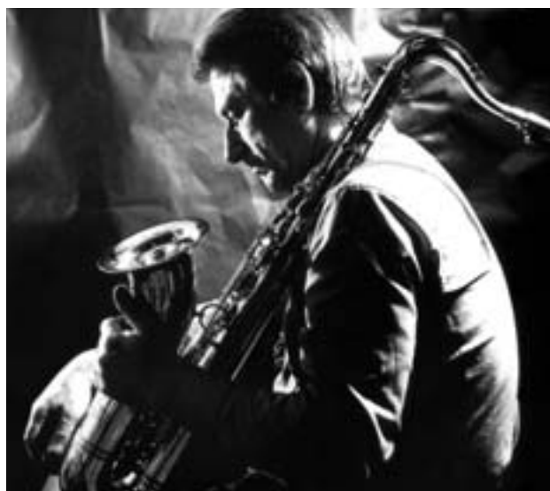
Pedro Iturralde en el Festival de Jazz de Madrid del 18 de noviembre de 1987, celebrado en el Teatro Albéniz.

En junio de 1992, con ocasión de la cumbre de la Comunidad Europea en Maastricht, su tema "Old Friends" fue incluido en el repertorio que interpretó la Big Band de Maastricht.