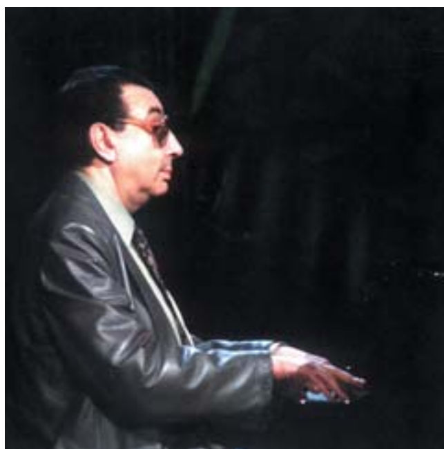
Tete Montoliu durante una actuación en directo en Madrid.

Giras, grabaciones, recitales, festivales fueron una constante en la vida de Tete Montoliu, quien en 1994 llevó la música de jazz a países como Egipto, Jordania y Siria. En 1996, recibió un homenaje a nivel nacional en el Teatro Monumental de Madrid por sus "50 años de jazz", homenaje organizado por la Sociedad General de Autores de España, que, después de su muerte, creó la Bienal Premios Tete Montoliu de Jazz.