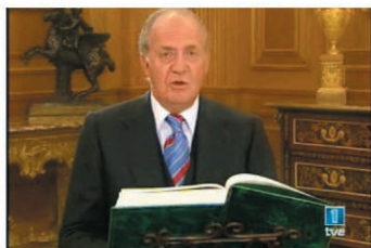
El Rey Juan Carlos abrió el programa de producción propia "10 líneas del Quijote"

Por último, "El Quijote de América", plasma la divulgación de esta obra en el mundo, coincidiendo con la feria del Libro de Guadalajara (México), que se ha dedicado este año, en parte, al Quijote .