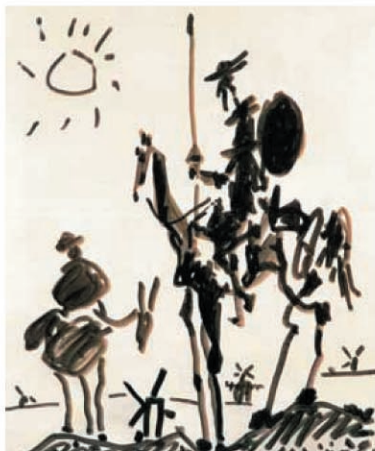
2. Don Quijote ha recorrido todos programas de TVE y RNE

Por su parte, el concurso semanal de La 2 "Palabra por Palabra" , ha creado la sección "Quijotadas" para acercar a los concursantes al léxico de "El Quijote" .