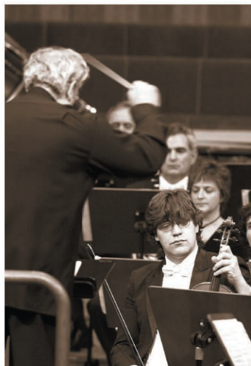
13. La Orquesta de RTVE ha ofrecido numerosos conciertos conmemorativos del Quijote

Radio Clásica ha transmitido el concierto inaugural del Festival Internacional de Música y Danza de Granada, basado en la figura de Don Quijote , a través de las obras que sobre el personaje de Cervantes compusieron Francesco Conti y Georg Philip Telemann .