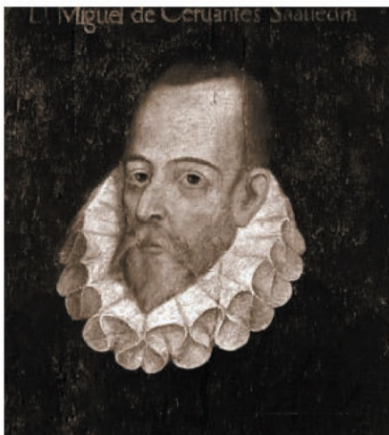
Miguel de Cervantes.

"En un hogar de la Mancha" , "Encuentros en la encrucijada" , "Las tentaciones de Palacio" y "Las bodas de Camacho 'El Rico'" , son los cuatro capítulos que integran la serie.