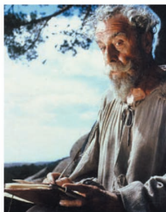
Fernando Rey interpreta a D. Quijote en una película dirigida por Gutiérrez Aragón

El espacio finalizará el 31 de diciembre con el Premio Nobel José Saramago y José Manuel Blecua , presidente de la Comisión Nacional para la conmemoración del IV Centenario de El Quijote .