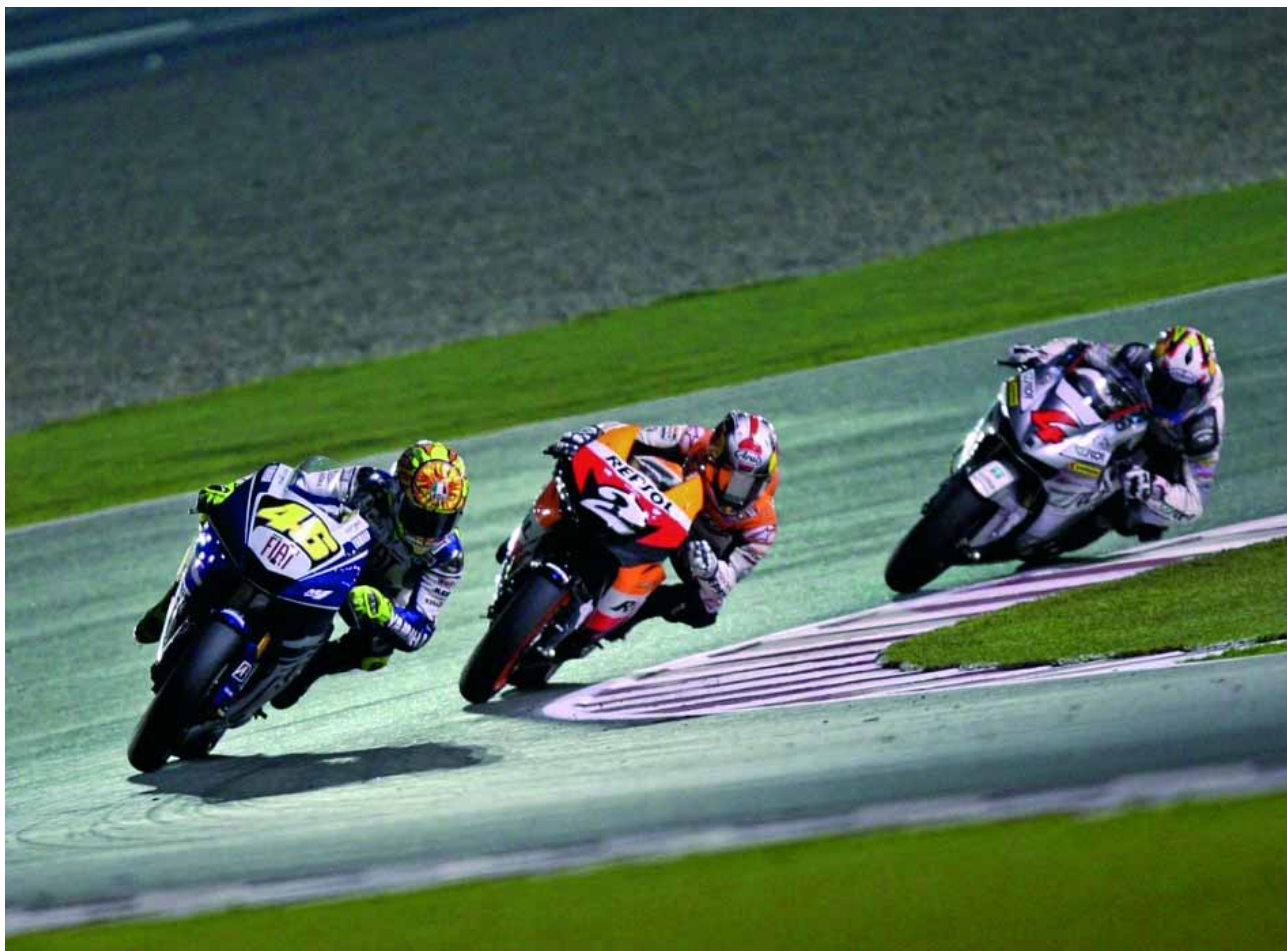
Dani Pedrosa (Honda) irá a por todas en la categoría reina.

El Gran Premio de España, que cada año reúne en Jerez a miles de aficionados al motociclismo, recibirá una atención especial por parte de Televisión Española. El miércoles 26 de marzo , la cadena pública se