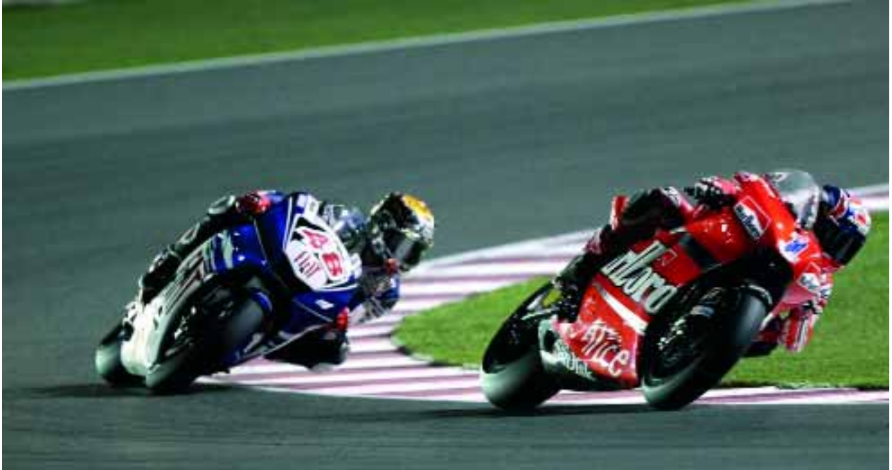
Jorge Lorenzo intentará imponerse al Campeón del Mundo Casey Stoner en MotoGP.