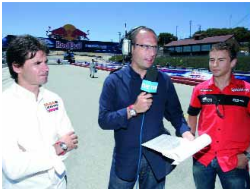
Ernest Riveras y Álex Crivillé junto a Jorge Lorenzo, que promete espectáculo en MotoGP.

Y, por supuesto, la cobertura de siempre: entrenamientos oficiales y carreras en directo en TVE , con un programa especial cada domingo que comienza las 9:30 que incluye el warm-up de la categoría reina y, en torno a las 00:30 en La 2, el programa "MotoGP Club" , que reunirá de nuevo a periodistas especializados, jefes de equipo, pilotos, mecánicos y otros protagonistas de la jornada para analizar lo que ocurra en cada Gran Premio. Además, las salidas y las llegadas de las tres cilindradas en directo en Radio 1 y Radio 5 con la voz de David Figueira, el profesional de RNE que sigue el Mundial.