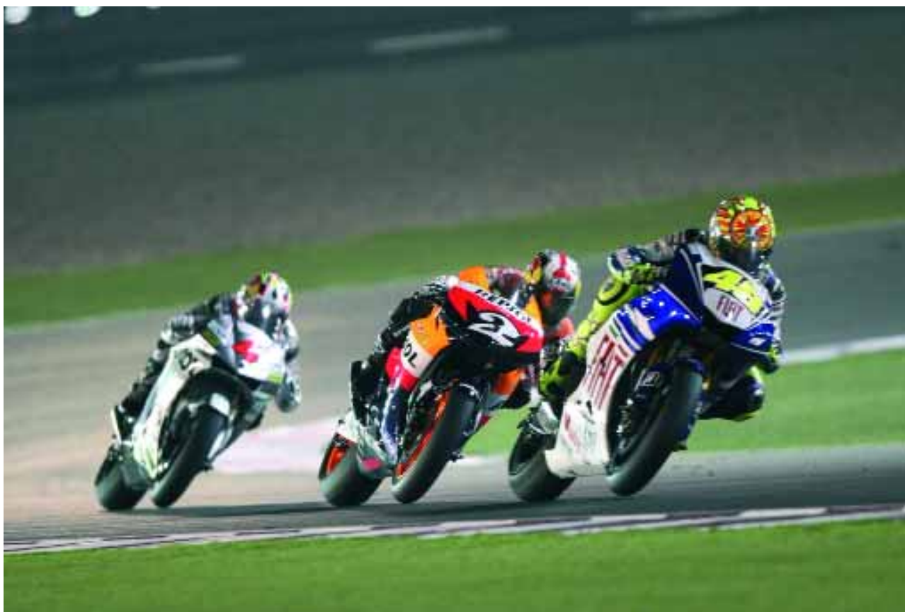
Valentino Rossi confía en sus posibilidades con neumáticos Bridgestone.

circuitos: las motos, las banderas a cuadros, los monos de los motoristas y los logotipos de TVE y MotoGP. El ruido de los pulsadores simulará el de una moto a gran velocidad y los concursantes llevarán cascos como si fueran comentaristas. Al final del programa, los tres equipos se subirán a un podio y al ganador se le entregará una copa, igual que se hace en la competición.