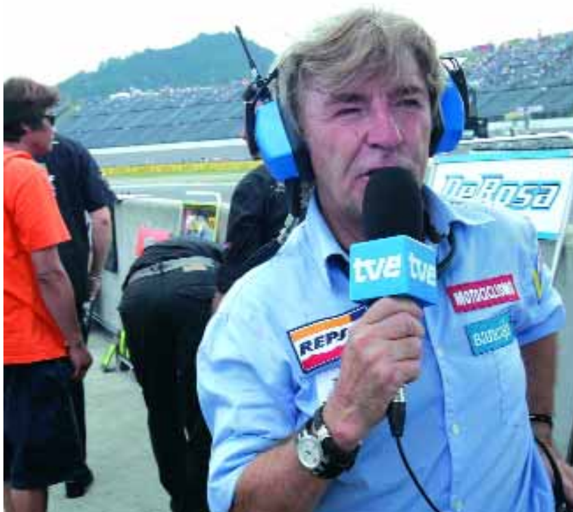
Ángel Nieto y Álex Crivillé continúan este año en TVE.