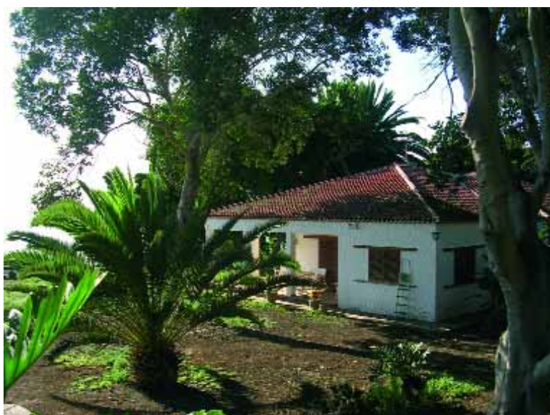
El paisaje excepcional de Tenerife, escenario de "Plan América".