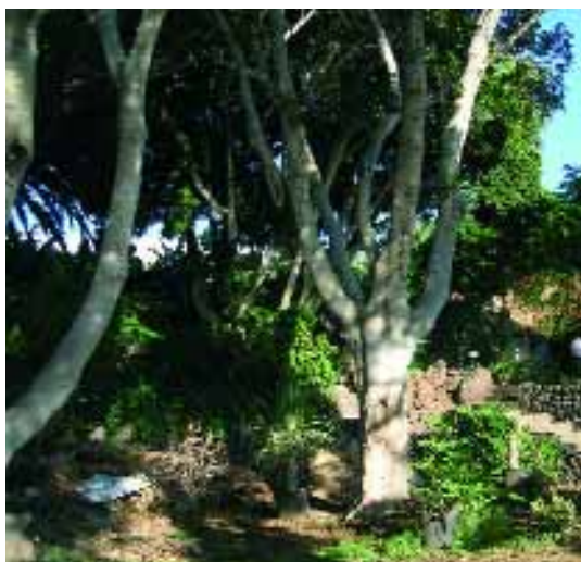
Una zona privilegiada de Tenerife se convertirá en Tukulapa, un lugar recóndito del corazón de Latinoamérica.