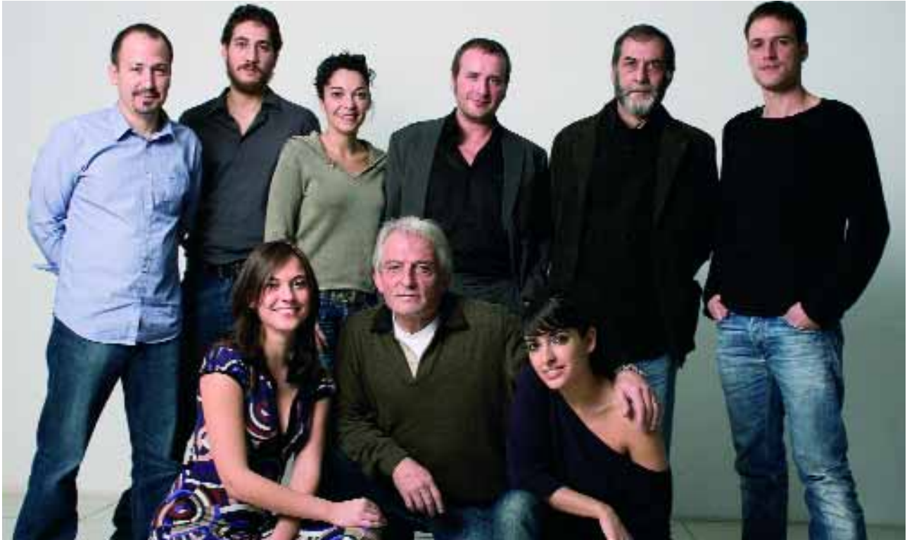
Plan América es una serie coral.