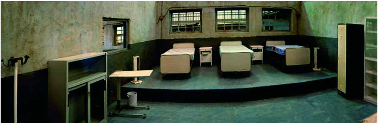
"Plan América" cuenta con 300 metros de decorados construidos.