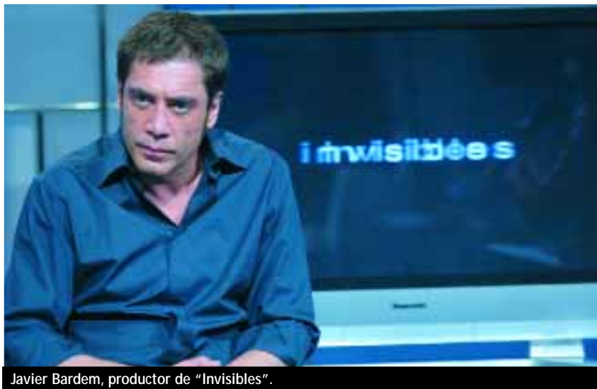
Javier Bardem, productor de "Invisibles".