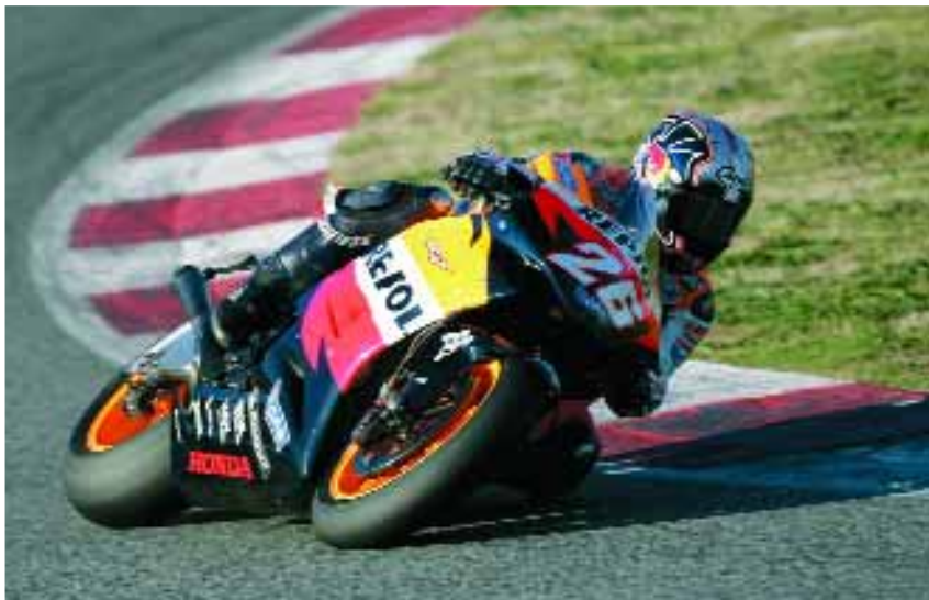
Valencia puso el cierre a la pasada temporada de MotoGP.

de una novela de Philip K. Dick a cargo de Ridley Scott ; y un ranking de libros más vendidos. En busca de la participación de los espectadores, el espacio facilita su web y convoca un concurso mensual de micro relatos que aludan a la televisión, que premiará con ejemplares de su "biblioteca esencial".