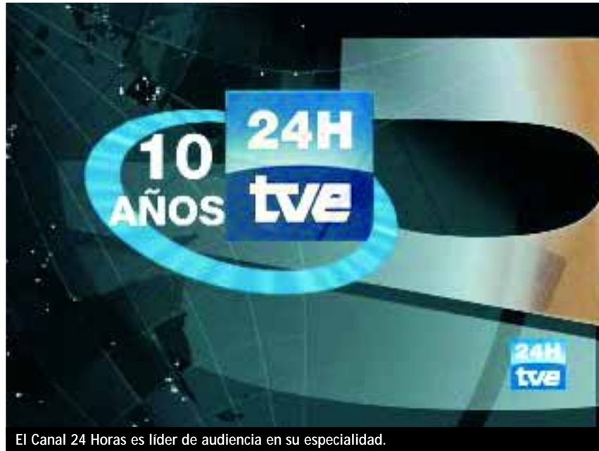
El Canal 24 Horas es líder de audiencia en su especialidad.

Radio Nacional de España estrena, bajo el lema "Escucha", su nueva temporada con un nuevo programa matinal: "En días como hoy", dirigido y presentado por Juan Ramón Lucas . El espacio se emite desde las 6:00 de la mañana hasta las 12:00 del mediodía, hora en que pasa el testigo a "España directo", otro nuevo programa, a cargo de Mamen Asencio , que con conexiones territoriales, información y reportajes, culmina la emisión matutina. A primera hora de la tarde se estrena "Asuntos propios",