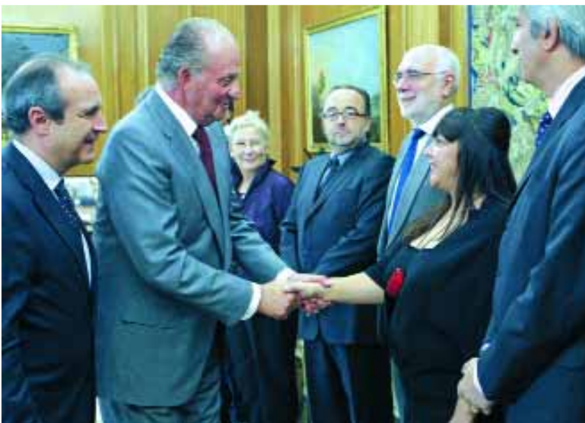
El Rey con los Consejeros de la Corporación RTVE.

El Rey recibe en audiencia al Consejo de Administración de la Corporación RTVE en el Palacio de La Zarzuela.