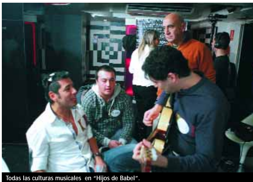
Todas las culturas musicales en "Hijos de Babel".

Tras la Gala FAO, y a lo largo de toda la semana, distintos programas de TVE, en colaboración con UNICEF de España , ofrecen documentales y reportajes cuyo propósito es hacer una llamada solidaria para que los telespectadores tomen conciencia de los graves problemas que pade-