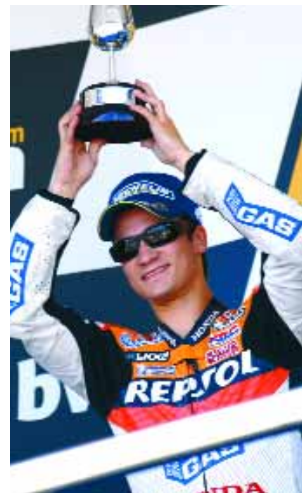
Éxito español en Qatar: Héctor Faubel 1º en 125 cc, Jorge Lorenzo 1º en 250 cc, Dani Pedrosa 3º en MotoGP.