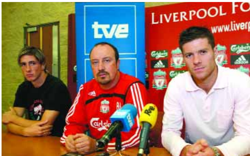
El Liverpool es uno de los equipos más "españolizados" de la Premier que desde este verano se ve gratis en La 2 y Teledporte.

puerta de su casa. La pieza se cierra con la frase: "Cada día somos más los que queremos ayudar. Todos contra la violencia de género. Ayuda a las mujeres maltratadas".