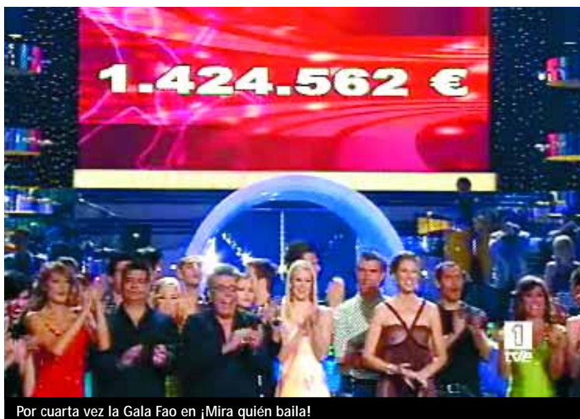
Por cuarta vez la Gala Fao en ¡Mira quién baila!

La Selección Española de fútbol, en TVE. TVE y Santa Mónica Sport, entidad que gestiona los derechos de la Real Federación Española de Fútbol, suscriben en Prado del Rey, un acuerdo que permitirá a TVE ofrecer, hasta 2012, un mínimo de 8 partidos de la selección absoluta y 5 de la Sub-21, incluyendo los clasificatorios para la fase final del