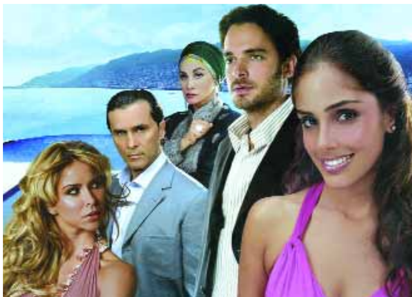
"Marina", por primera vez una televisión española estrena una serie en internet.