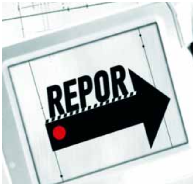
El reportero de calle en "Repór".