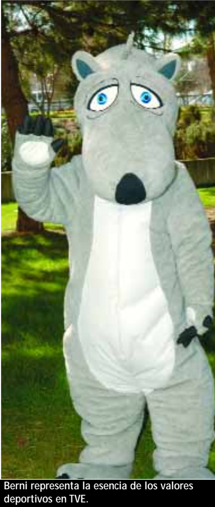
Berni representa la esencia de los valores deportivos en TVE.

También se aprueba el organigrama básico de la Corporación propuesto por el Presidente y la creación de cuatro comisiones de trabajo en el seno del Consejo .