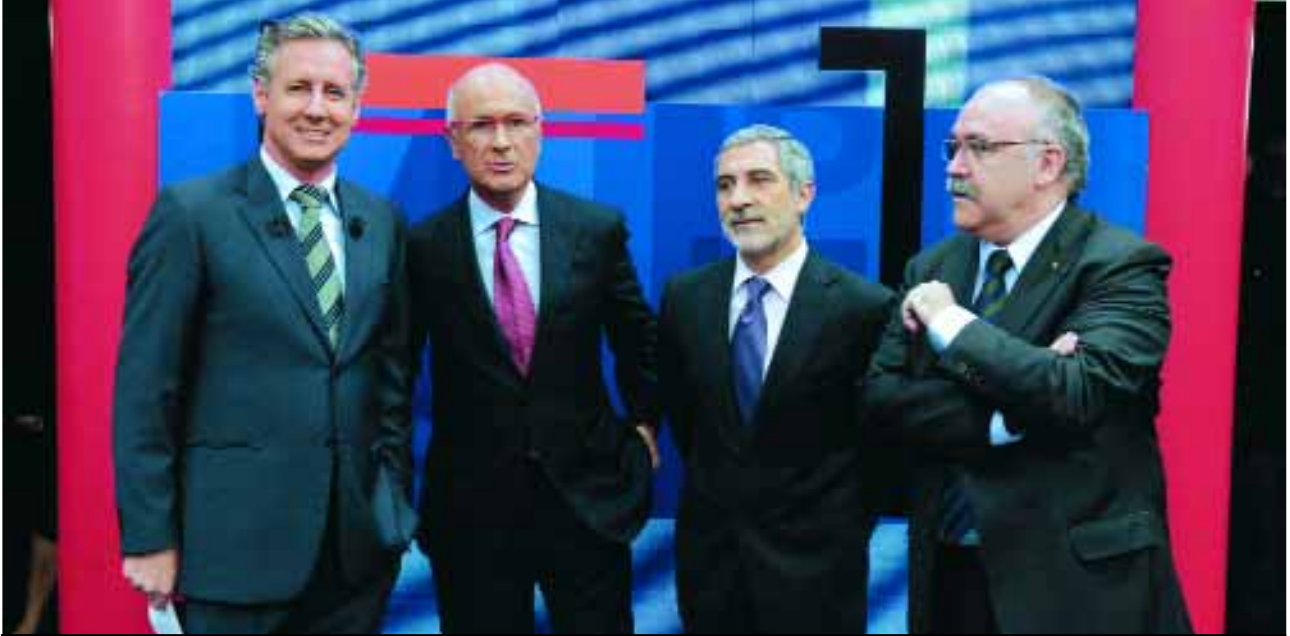
Lorenzo Milá, Josep Antoni Durán i Lleida, Gaspar Llamazares y Josep Lluís Carod Rovira.