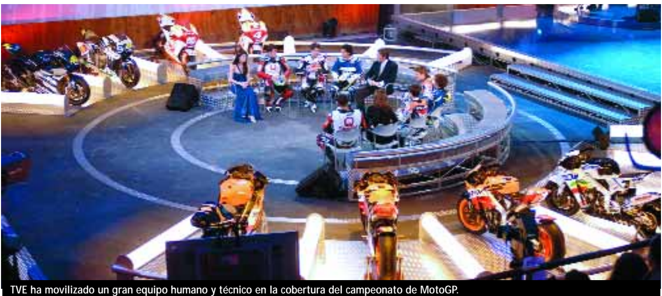
TVE ha movilizado un gran equipo humano y técnico en la cobertura del campeonato de MotoGP.

La 1 emite la Gala Motopasión , presentada por Sonia Ferrer , con la colaboración de Anne Igartiburu y Paula Vázquez , que reúne a estrellas de MotoGP y de la canción, en