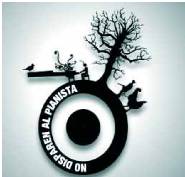
La música en directo tiene su sitio en "No disparen al pianista".