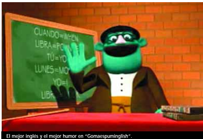
El mejor inglés y el mejor humor en "Gomaespumenglish".