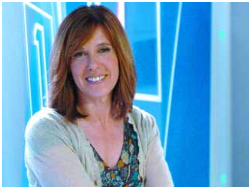
Los informativos de TVE han sido los más vistos en 2007.

TVE emite la gala especial "¡Mira quién baila! en Nochebuena", presentada por Anne Igartiburu y con la actuación musical de David Bisbal . En el espacio, Pilar García Muñiz y Enric Company (España directo), Carmen Sevilla y Juan Carlos Cerezo (Cine de barrio), Mar Regueras , Fabio Testi , e Iker Lastra (Herederos), María José Molina (Gente) y Antonio Garrido (Identity), muestran su desconocida faceta como bailarines, enfrentándose a tan diversos ritmos, como