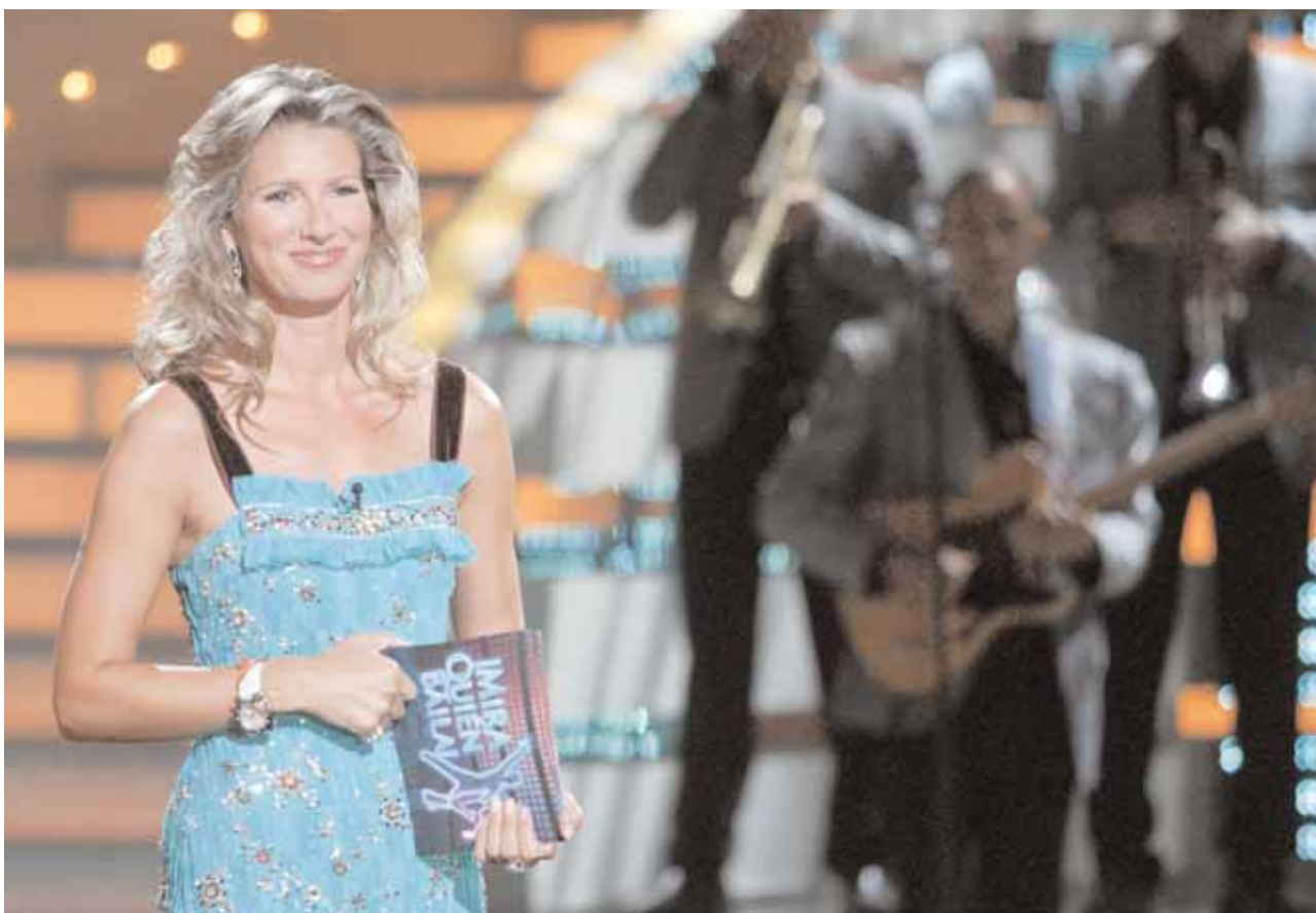
Anne Igartiburu continúa al frente de "Mira quién Baila".

Anne Igartiburu se vuelve a poner al frente de este exitoso concurso de baile que cuenta, desde su estreno, con el respaldo de los telespectadores. El programa mantiene el reto de seguir entreteniéndolo a toda la familia, además de ayudar a una buena causa.