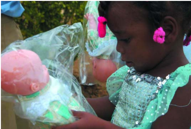
El juguete desempeña un papel destacado en el proceso formativo de los más pequeños.

GUATEMALA. Guatemala se encuentra en pleno proceso de reconstrucción tras el paso del huracán Stan, que ha dejado un centenar de heridos y miles de personas sin hogar. La campaña "Un Juguete, Una Ilusión" llegará por primera vez a este país a través de la "Asociación Salesiana don Bosco" que trabaja con los niños de las zonas más afectadas.