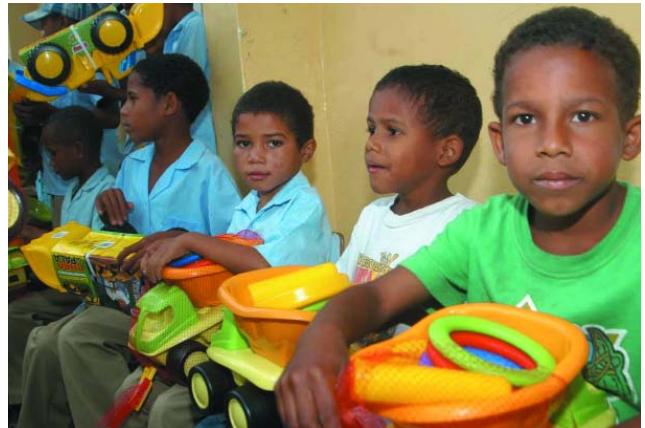
El juego es una herramienta que fomenta la socialización y los vínculos afectivos.

BOSNIA HERCEGOVINA. Situada en los Balcanes, es la república más pobre de las que constituyeron la antigua Yugoslavia. La guerra estancó su economía y todavía se trabaja en la reconstrucción del país. En la sexta edición la campaña "Un Juguete, Una Ilusión" llegará por primera vez a este país a través de la Asociación Española de Cooperación Internacional (AECI).