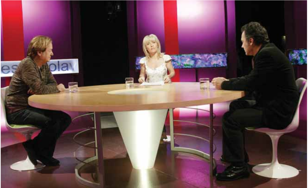
"Versión Española" comienza su décima temporada.

El feliz cumpleaños de "Versión española" viene precedido de un regalo previo a la celebración de su décimo aniversario. El programa festeja su primera década de vida con el reconocimiento oficial a su labor de apoyo al cine español: la concesión de la Medalla de Oro al Mérito en las Bellas Artes .