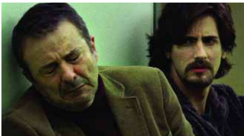
Juan Diego y Juan Diego Botto protagonizan la película "Vete de mí".

El programa arranca la temporada, el 21 de septiembre , en San Sebastián. Una cita a la que es fiel "Versión Española" y que en esta ocasión, además de acercarse a lo que allí pase incluirá la emisión de una de las películas destacadas de