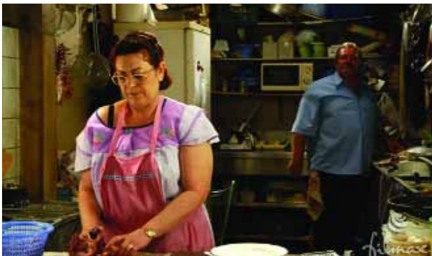
"Tapas", de José Corbacho y Juan Cruz.