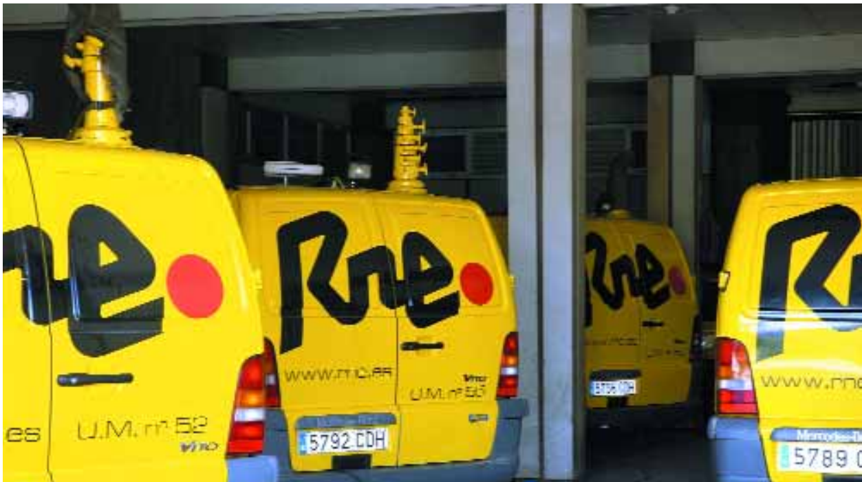
Radio 5 desplazará a sus redactores al lugar de la noticia en los temas destacados.