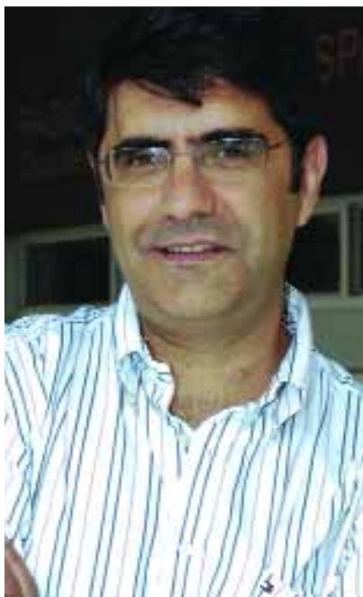
Manuel Ventero retrata los perfiles más interesantes en "Siluetas".

como "Dinero y Trabajo" en Radio 1 o "España exporta" y "Producido en España", de Radio Exterior. Colaborador de numerosos medios escritos, desde enero de 2007 dirige "Documentos".