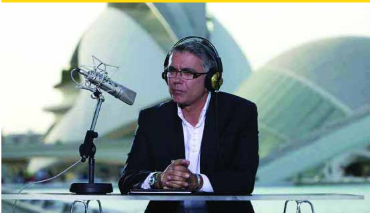
Juan Ramón Lucas se incorpora a RNE en el magacín "En días como hoy".