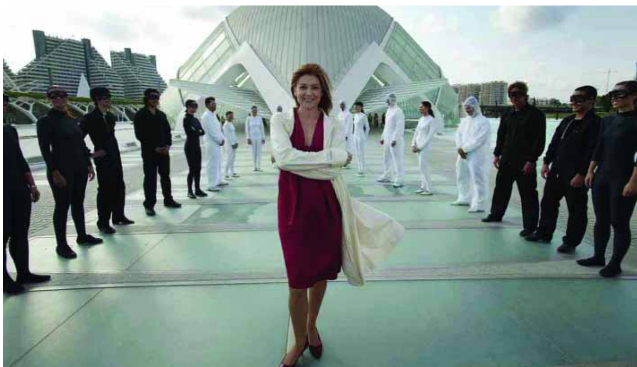
Pepa Fernández continúa al frente de "No es un día cualquiera" en la nueva temporada.