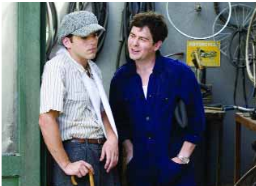
El taller de los Juanitos será uno de los nuevos escenarios.