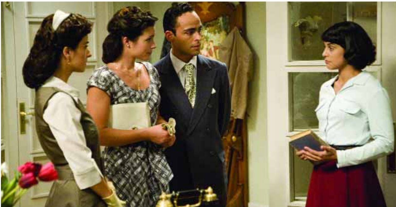
La serie recrea el periodo entre 1948 y 1950.