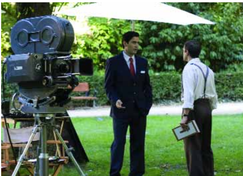
La productora Numancia Films entra en escena en los nuevos episodios.

Además, "Amar en tiempos revueltos" estrena una nueva plazoleta, anexa a la Plaza de los Frutos, donde se ubica la casa de los Roldán. Los nuevos negocios, como la joyería y la tienda de bicicletas de Los Juanitos, también tienen sus decorados. La productora Numancia Films es otra de las nuevas ambientaciones.