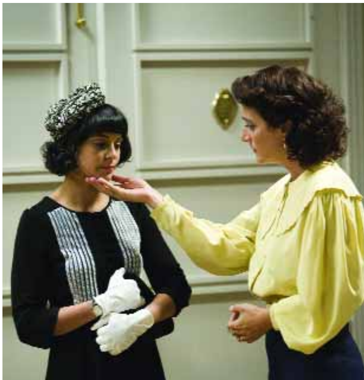
Alicia tendrá que adaptarse a su nueva vida en España.