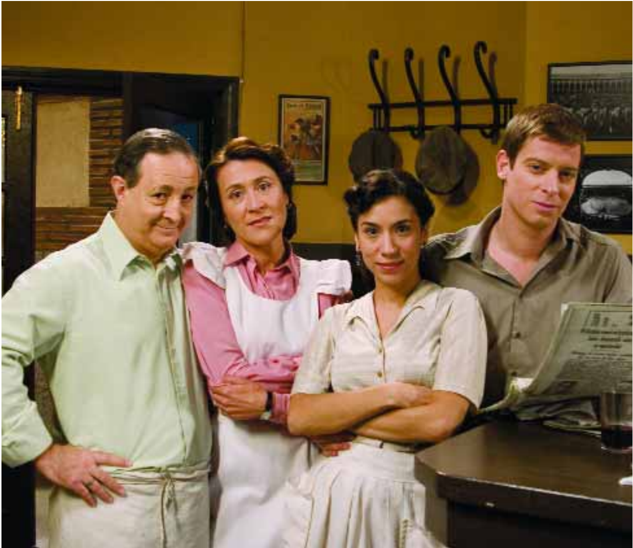
El bar El Asturiano, reflejo de la vida de la época.

El miércoles, 29 de agosto, comienza en La Primera de TVE la tercera temporada de “Amar en tiempos revueltos”, la producción ambientada en la posguerra española que ocupa las sobremesas de la cadena desde septiembre de 2005. Producida por Diagonal TV, la serie