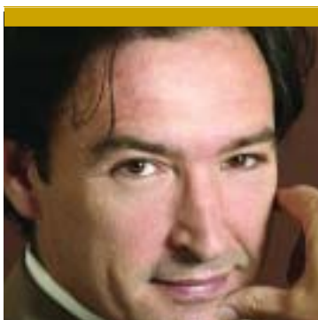
Ginés García Millán es otro de los protagonistas de "Herederos", serie de ficción que emitirá TVE.