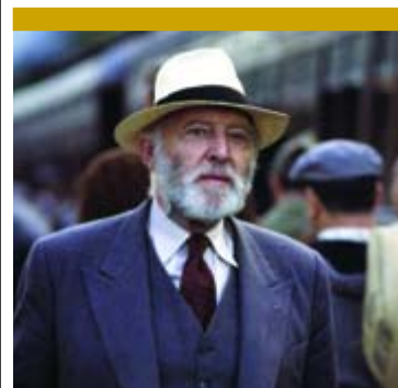
El veterano actor Álvaro de Luna será Antonio Moro, el mayoral.

Juan Tenorio" (1966), "Las arrecogías del Beaterio de Santa María Egipcíaca" (1977), "Mata Hari" (1983), "Mamá, quiero ser artista" (1986), "La rosa tatuada" (1997) o la nueva versión de "Filomena Marturano" del 2006. La huella que ha dejado en televisión es inolvidable, fundamentalmente en las grandes series de TVE. Debutó con "Estudio 1", y registró numerosos éxitos como "Las brujas de Salem" (1973), "Teresa de Jesús" (1984) o "Arroz y tartana" (2003).