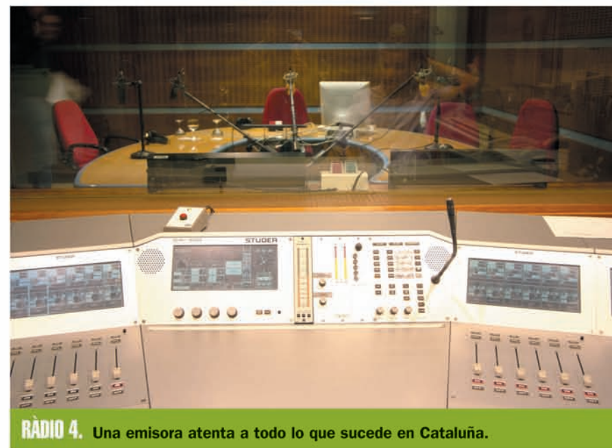
RÀDIO 4. Una emisora atenta a todo lo que sucede en Cataluña.

En su franja matinal insiste en el concepto de radio pública como sinónimo de radio rigurosa y de servicio. El