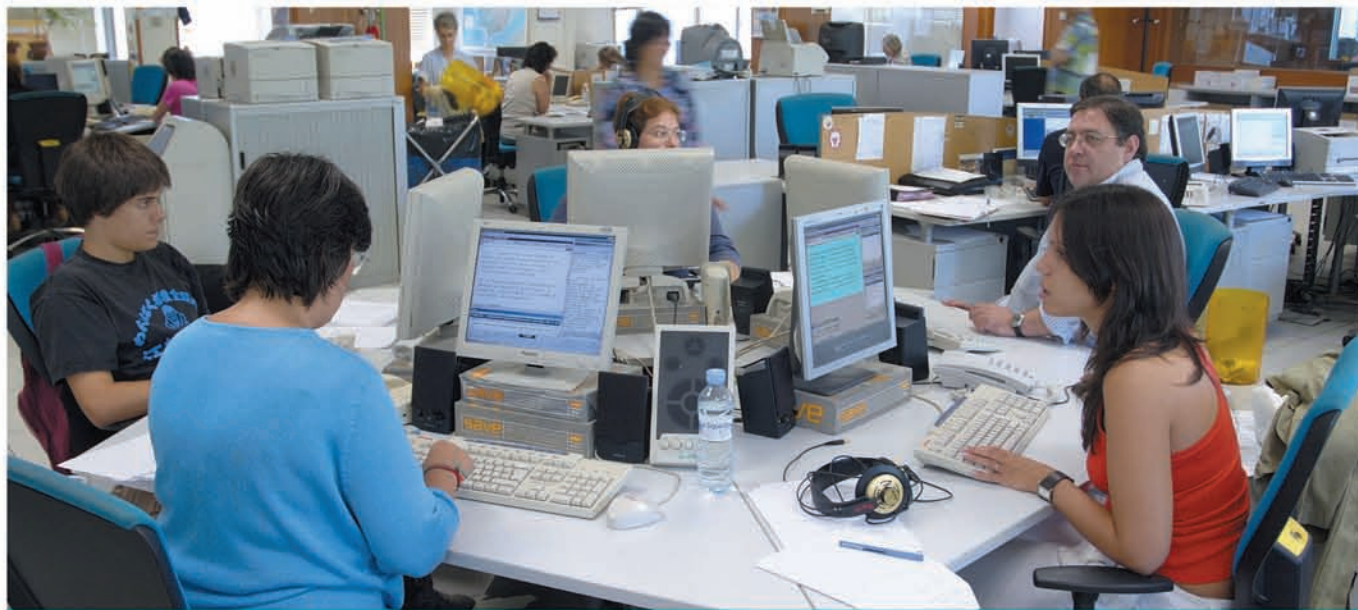
REDACCIÓN CENTRAL. Recoge y elabora las noticias que se ofrecen en todas las emisoras de Radio Nacional.