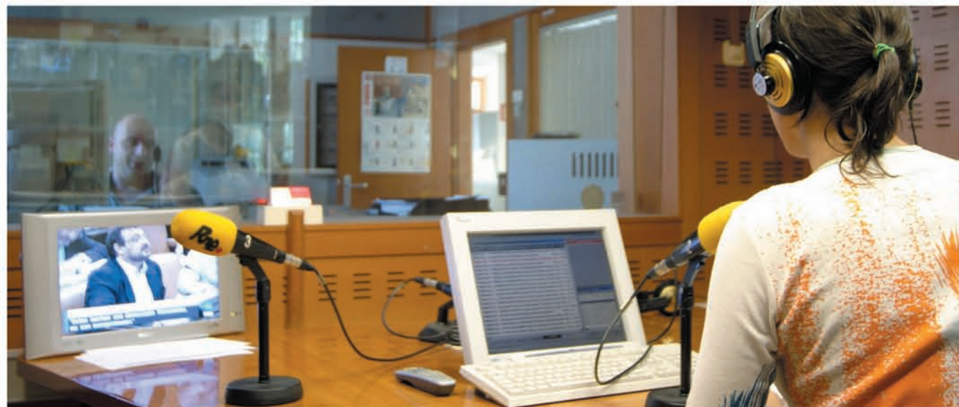
RADIO CLÁSICA. Veinticuatro horas ininterrumpidas de la mejor música para deleite de melómanos.