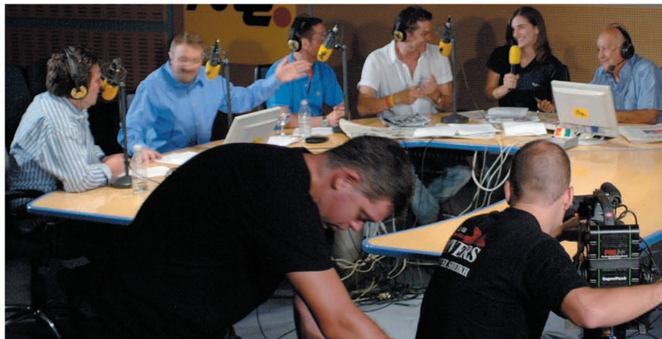
BUENOS DÍAS. El magacín de la mañana arranca con información y tertulia para acabar con humor y entretenimiento.