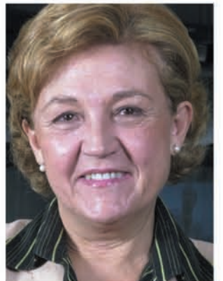
CARMEN CAFFAREL SERRA Directora General de RTVE

Con el firme propósito de conseguir esa nueva RTVE del siglo XXI, y con la mejor de nuestras ilusiones, emprendemos esta temporada que no será, como señalaba al principio, una más. Estamos llamados a afrontar en los próximos meses una serie de retos excepcionales. Estoy convencida de que, con la ayuda y el esfuerzo de todos, podremos responder adecuadamente al desafío que tenemos por delante.