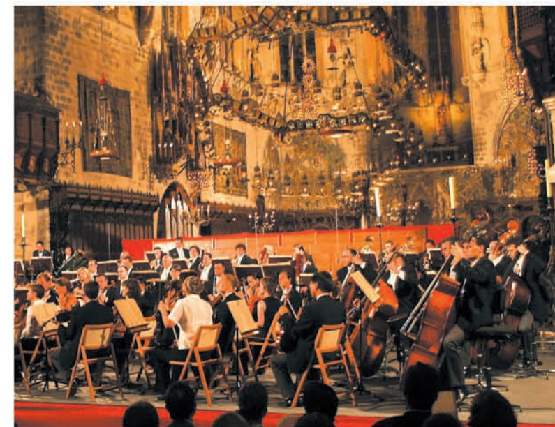
Orquesta y Coro de RTVE, dirigidos por Adrian Leaper, en la catedral de Palma.

RADIO CLÁSICA DEDICARA ESPECIAL ATENCIÓN EN 2006 AL 250 ANIVERSARIO, DEL NACIMIENTO DE MOZART