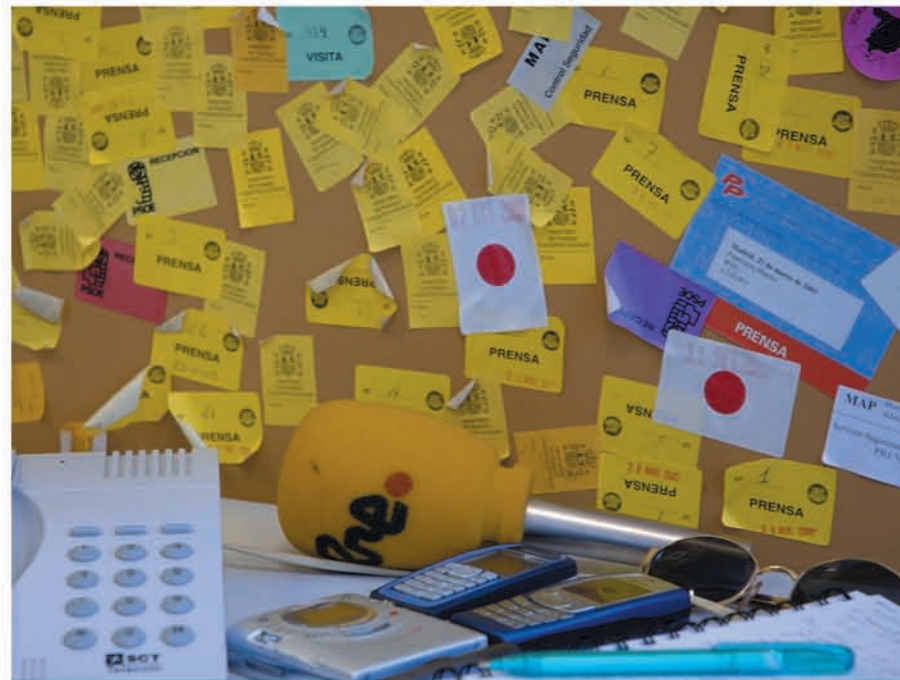
RADIO EXTERIOR. La encargada de promocionar la imagen de España en el mundo.