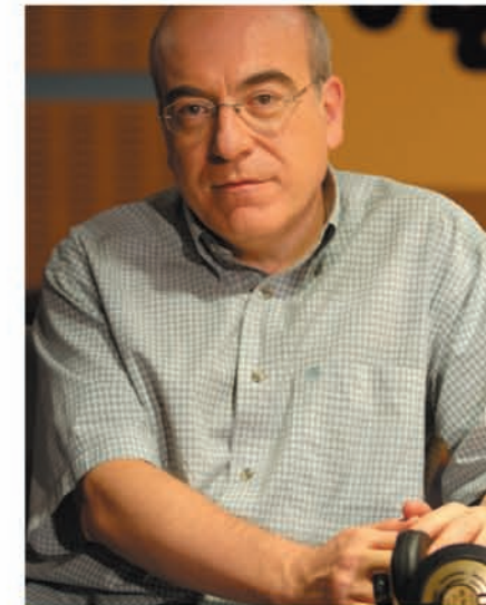
JULIÁN SALGADO Dirige y presenta "España a las 8".

Las noticias y las entrevistas son los elementos básicos que dan forma al primer informativo del día en Radio 1. Las informaciones se actualizan de forma permanente. También se hace un repaso minucioso a los acontecimientos más importantes del día anterior.