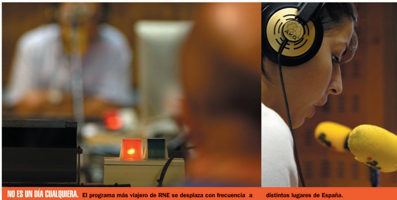
NO ES UN DÍA CUALQUIERA. El programa más viajero de RNE se desplaza con frecuencia a distintos lugares de España.

Entre los numerosos colaboradores de No es un día cualquiera figuran el humorista Antonio Fraguas , "Forges"; el periodista Andrés Aberasturi , el filósofo José Antonio Marina y José María Íñigo , destacado profesional de la televisión y de la radio muy vinculado a la historia de Televisión Española.